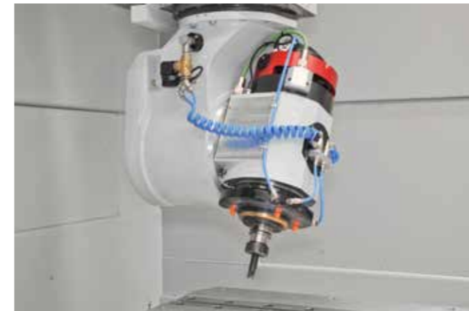
采用直接驱动技术的5轴切割头