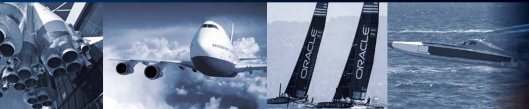
航空航天 | 一级方程式赛车 与赛车运动 | 汽车 | 航海