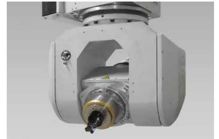
FX5 带双扭矩电机驱动的货叉单元