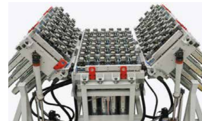
UHF倾斜工作台 工作台中央部分是固定的，两个侧翼部分可以倾斜最大至45°；倾斜度由CN电动数控。最小曲率半径零件加工的最佳解决方案。