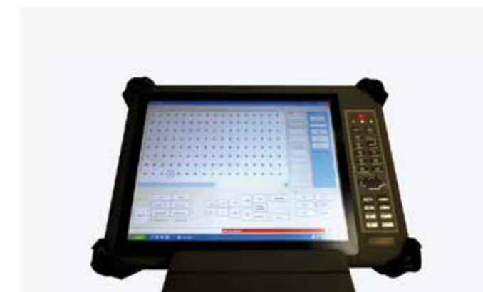
UHF工作台管理控制面板 工作台编程和防撞击控制软件直接集成在CAD/CAM系统中。