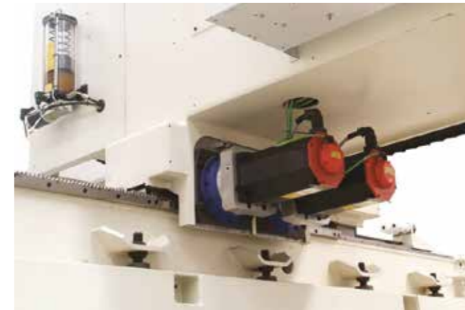
电气游隙恢复运动学(双电机) 以保证更高的硬度和精度