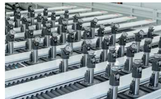
3/5轴 UHF工作台 该系统允许在加工过程中需要最大支撑的区域对执行器和吸盘进行精准定位。