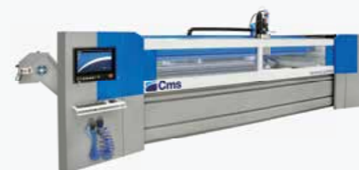
TECNO CUT PROLINE