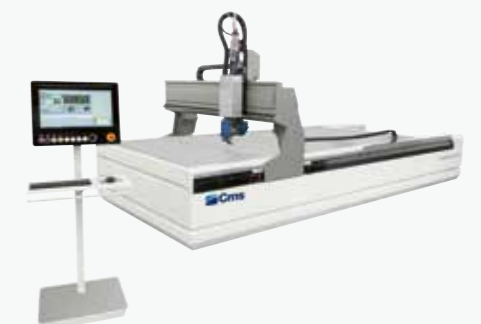
TECNO CUT SMARTLINE