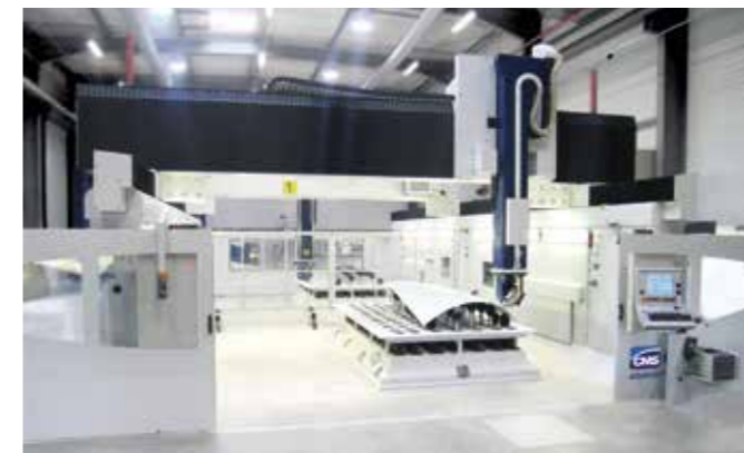
MATRIX UHF工作台 带有即插即用执行器的框架结构。

CMS通用夹紧装置（UHF）工作台具有不同配置：水平、立式、倾斜、单轴、多轴式（包括专利5轴解决方案）以及与Ethos机床不同型号集成所需的各种尺寸。