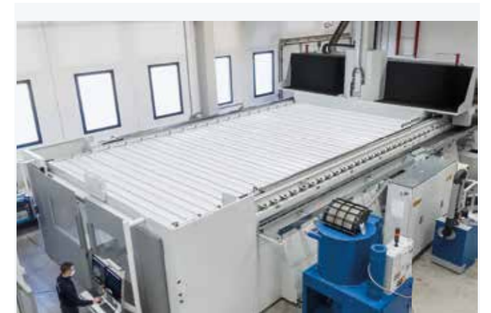
顶部波纹管式封口，可容纳灰尘和切屑