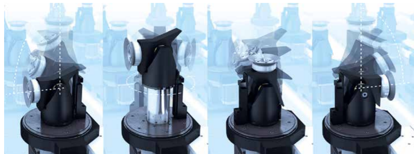
受控空间定向 (0-90°/360°) CN数控5X倍执行器