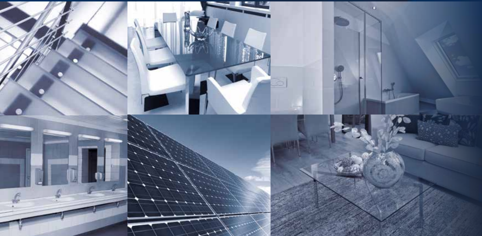
espelhos | box chuveiro | fotovoltaico | mesas