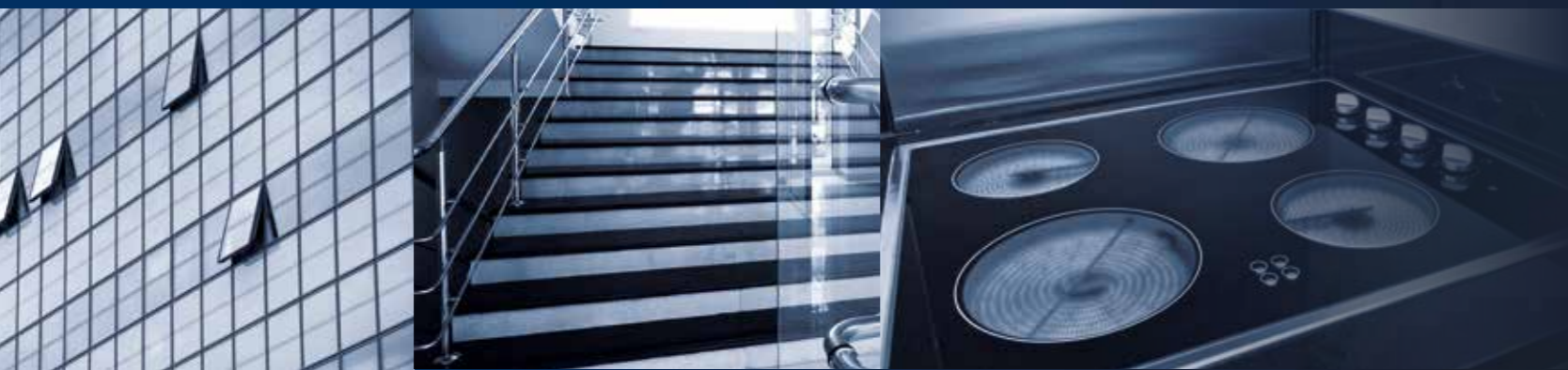
escada | portas | fachadas estruturais e janelas | fornos e planos de cozimento

G enius. O ptimized. O perational. D urable solutions.