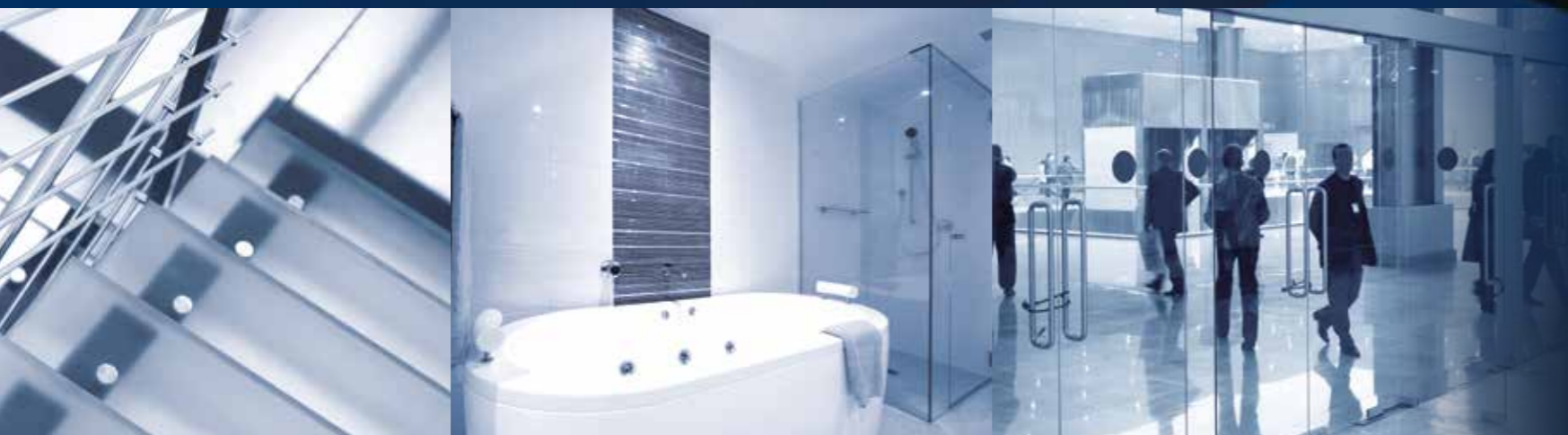
portas | escadas | bancada para casa de banho