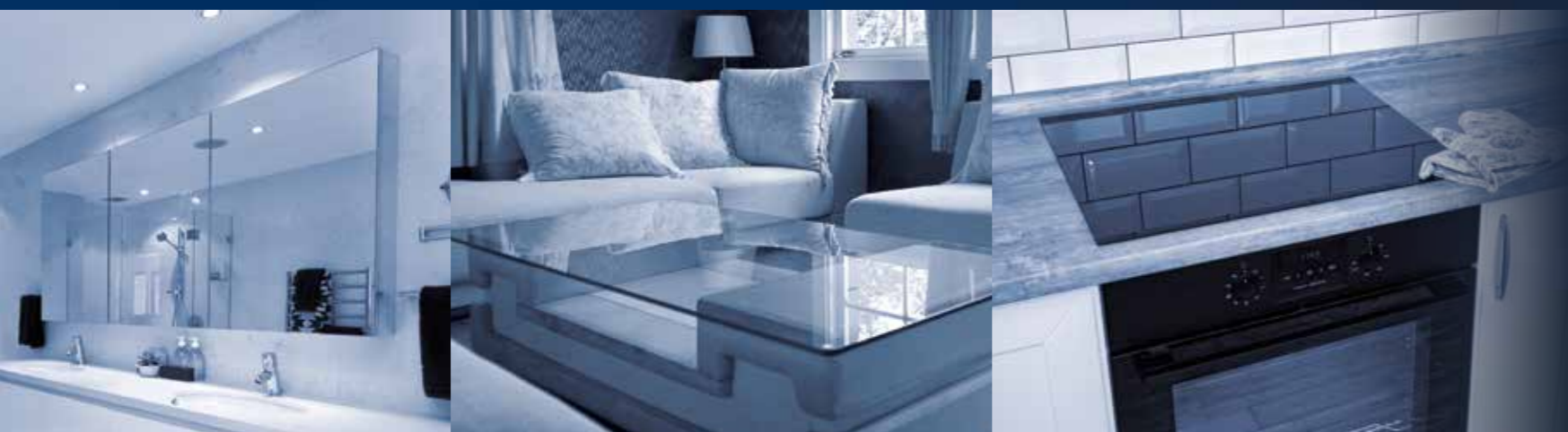
зеркала | столы | печи и варочные панели

T echnological. O riginal. P erforming solutions.