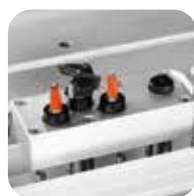
Groupe pour Charnières accessoires de haute technologie

Perceuse multiple monotête à 21 mandrins idéale pour les menuisiers et les artisans exigeants.