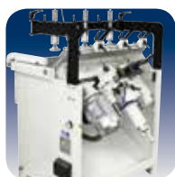
Tête à Percer perçage parfait