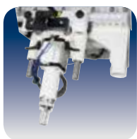
Système de Nettoyage propreté surprenante